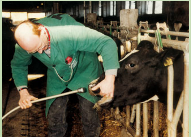
Abb.1: Einführung der Schlundsonde

Das Drenchen sollte innerhalb der ersten 4 Stunden, besser aber innerhalb der ersten 2 Stunden nach dem Kalben vorgenommen werden.