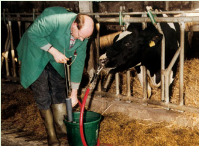
Abb.2: Applikation des Drenchgemisches

Zunächst sollte eine kleinere Menge (ca. 5 l) appliziert werden. Die Kuh darf dabei nicht würgen, sonst stimmt etwas nicht. Dann muss der Sitz der Sonde nochmals überprüft werden. Wenn alles in Ordnung ist, wird die Drenchlösung in den Pansen gepumpt.